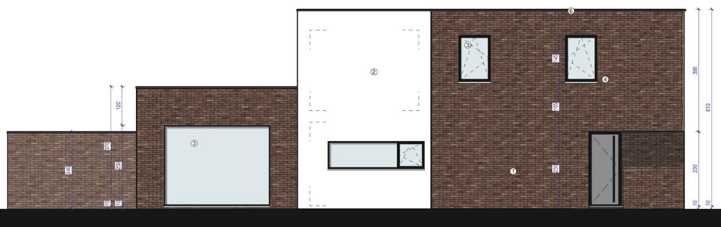
ZIJGEVEL LINKS WONING 1