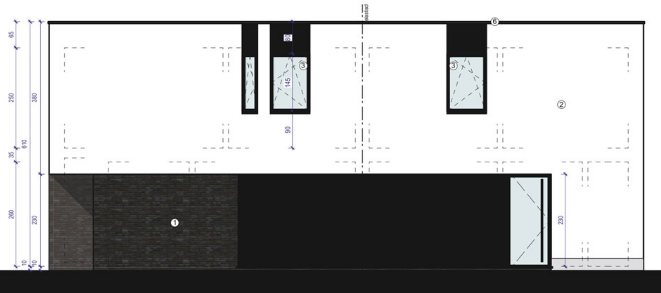
VOORGEVEL woning 1+2