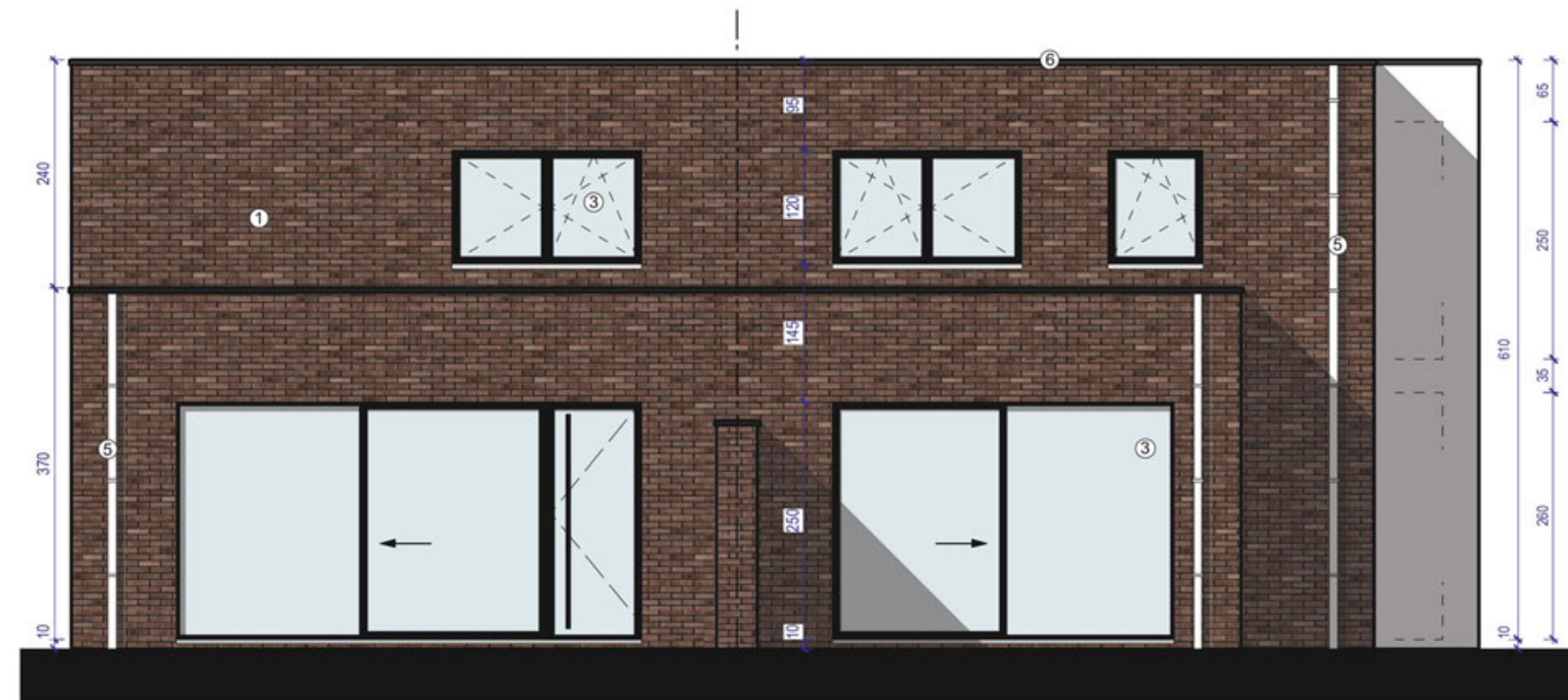
ACHTERGEVEL woning 1+2